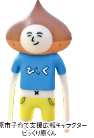
栗原市子育て支援広報キャラクター ビズリ原くん