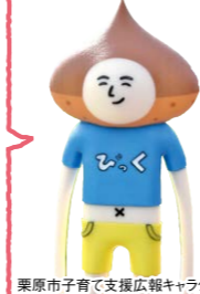
栗原市子育て支援広報キャラクター ピッコリ原くん